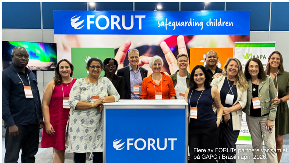
Flere av FORUTs partnere var samlet på GAPC i Brasil i april 2026.

Utviklingsminister Åsmund Aukrust besøkte FORUTs hovedkontor på Gjøvik i august 2025. Psykisk helse og rus i utviklingspolitikken sto på agendaen. Ikke-smittsomme sykdommer utgjør mer enn 70 prosent av for tidlige dødsfall globalt. Når verden nå opplever store kutt i bistand, er det avgjørende at helse ikke blir nedprioritert. Aukrust har satt i gang «Prosjekt Vendepunkt» som skal føre til en stortingsmelding om norsk utviklingspolitikk i 2027. Her har FORUT deltatt aktivt i samtalen og med innspill gjennom prosessen.